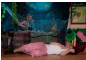
Vodnická pohádka (2013)

· V roce 2014 opakují ochotníci hru „Vodnická pohádka“ 8. 3. v Milovicích a v „opravdovém“ divadle na festivalu Pohádková Chocěň. V tomto roce se divadelníci opravdu činili, nastudovali dvě premiéry. Pohádku „Jak to bylo s drakem“ a komedii „Ne-ru-šit“. Pohádku „Jak to bylo s drakem“ viděli i diváci 24. 8. na Bartolomějské pouti a 20. 9. na Hořické trubičce v Hořicích.