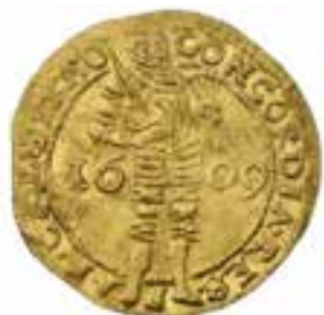
ilustrační obrázek belgického dukátu z r. 1609

1906 Na poli při orání nalezen zlatý dukát belgický z r. 1609.