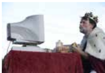
Hloupý Honza (2011)

· V roce 2015 byla sehrána premiéra rozverná komedie ze současnosti „Andělka“. Tradičně hru viděli diváci 30. 8. na Bartolomějské pouti v Chodovicích, 14. 11. v Bříšřanech a tentokrát 13. 12. i v Lískovicích.