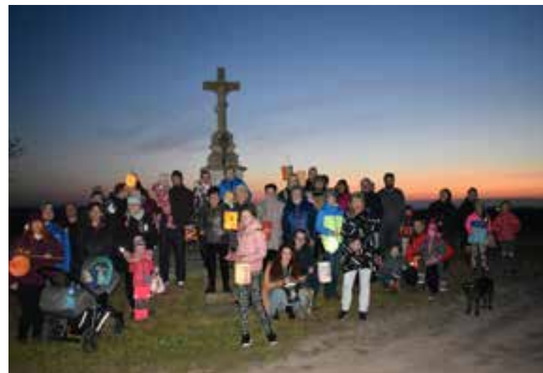
Lampionový průvod (2021)

• V červnu 2026 pořádáme již 5. Sjezd rodáků a přátel obce a 5. září oslavu 90 let od založení SDH Bílsko u Hořic .