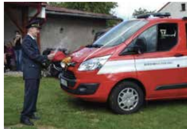
slavnostní předávání nového hasičského auta (2017)

Při Memoriálu V. Kopeckého nám byl slavnostně předán hasičský automobil Ford Tranzit L2.