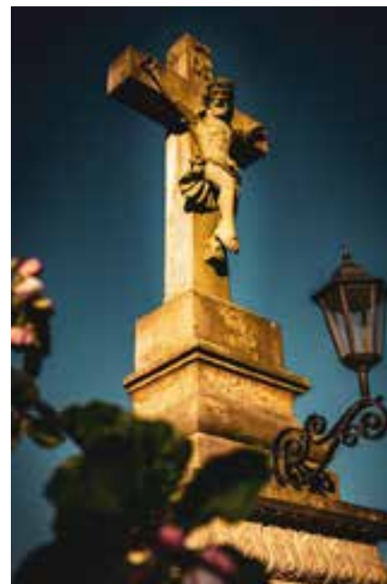
pískovcový kříž z r. 1861, obnoven 1906, 2009