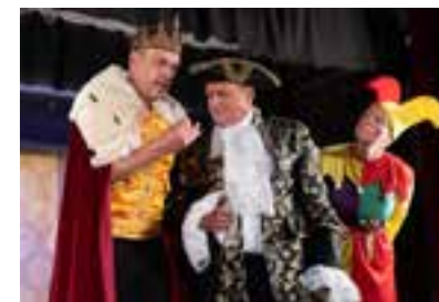
Začarovaný les (2025)

· Rok 2020, rok covidový. Nezkouší se. Na sousedské posezení 15. 8. byla „oprášena“ vůbec první hra „Lednička“. I tak měla úspěch i u sousedů v Chodovicích na Bartolomějské pouti.