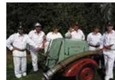
naši veteráni s historickou stříkačkou Stratilek z roku 1936

• V roce 2009 se v únoru konalo „Pytlování v Sudole“.