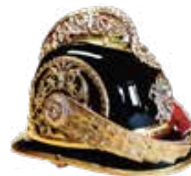
hasičská přilba typická pro období první republiky nebo Rakouska-Uherska

• Od roku 2008 pravidelně pořádají velikonoční a vánoční turnaj ve stolním tenisu, který se těší velké oblibě a účastní se ho velký počet soutěžících.