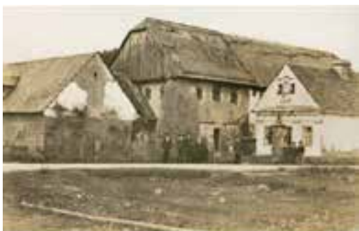
stará tvrz v Bílsku (č.p. 11)

Vážení spoluobčané, rodáci a přátelé naší krásné obce Bílsko u Hořic , dostává se Vám do ruky informační brožura vydaná u příležitosti 640. výročí první písemné zmínky o obci a zároveň k 5. Sjezdu rodáků v roce 2026. Jedná se o rozšířené vydání brožury z r. 2022.