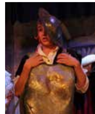
Jak to bylo s drakem (2014)