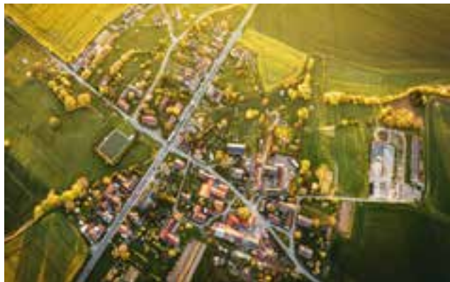
letecká fotografie obce Bílsko u Hořic z r. 2022