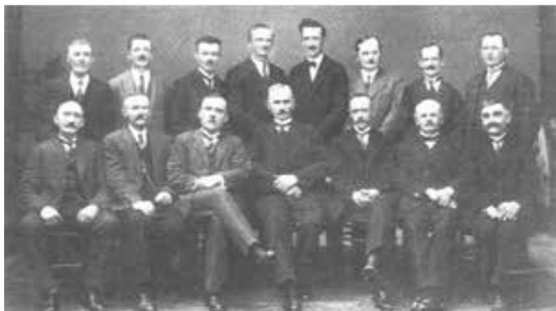
Jméno spolku: Spořitelní a záložní spolek pro Bílsko, Chlum a Libonice. Při této ustavující schůzi přistoupilo 25 členů