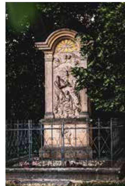
sv. Trojice z r. 1855, obnovená 1906 a 2009