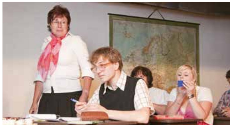
Kouzelná lavice (2012)