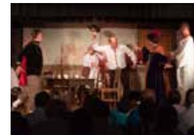
Kralování bez čarování (2024)

• V roce 2009 vybudováno nové jeviště, opatřena opona a vybudováno sociální zařízení (z odměny v soutěži Vesnice roku 2008). Na dětském dnu diváci shlédli „Pohádku o loupežnících“. Repríza proběhla na sousedském posezení spolu se třetím (a také posledním) pokračováním rodiny Burákových – fraškou „Dítě“.