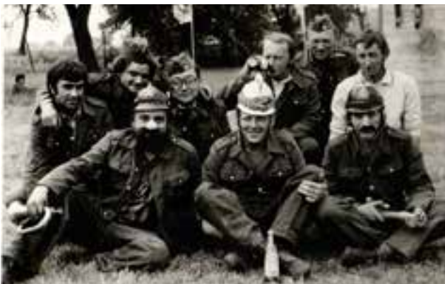
Hasiči v Bašnicích (1981)