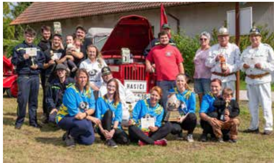
Memoriál Václava Kopeckého (2025)